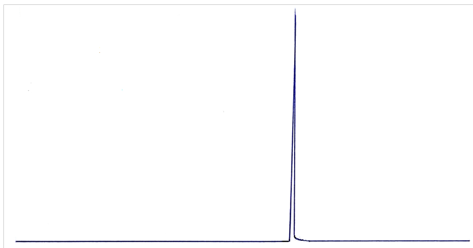
图 B.1 食品添加剂2,5-二甲基吡嗪气相色谱图